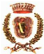
Comune di Giovinazzo Ass. alla Solidarietà Sociale