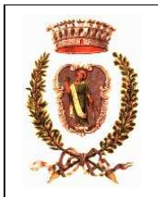
Comune di Giovinazzo Ass. alla Solidarietà Sociale