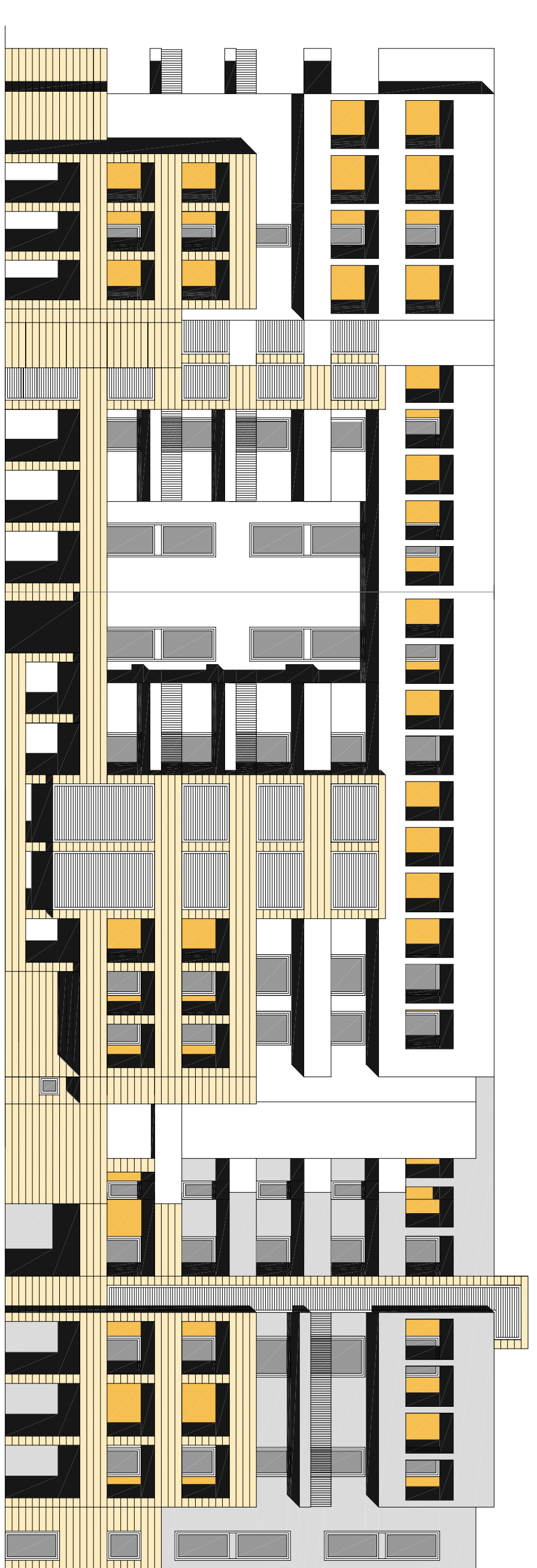
PROSPETTO EST 1:200