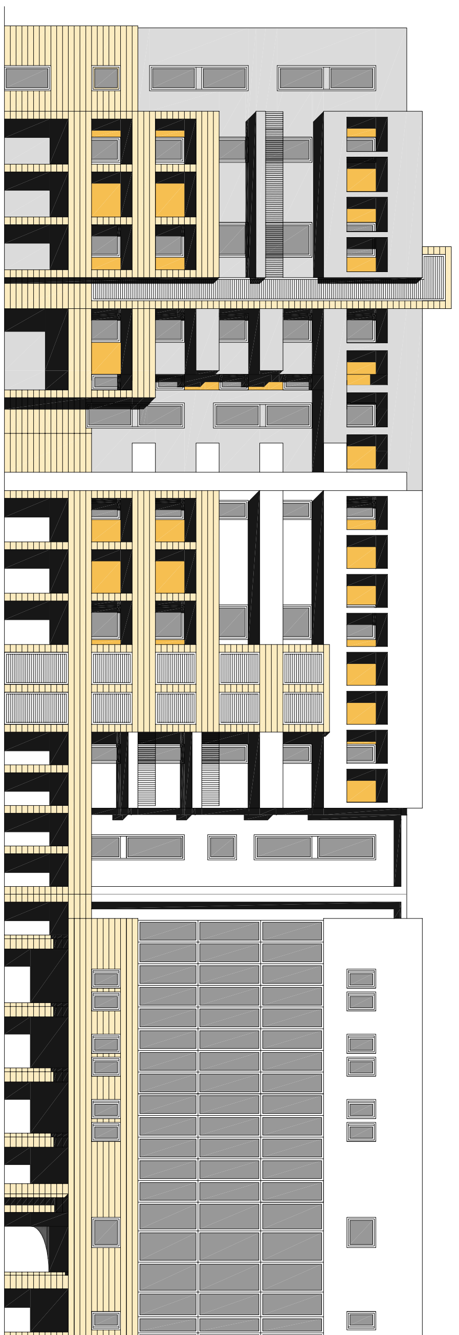
PROSPETTO OVEST 1:200