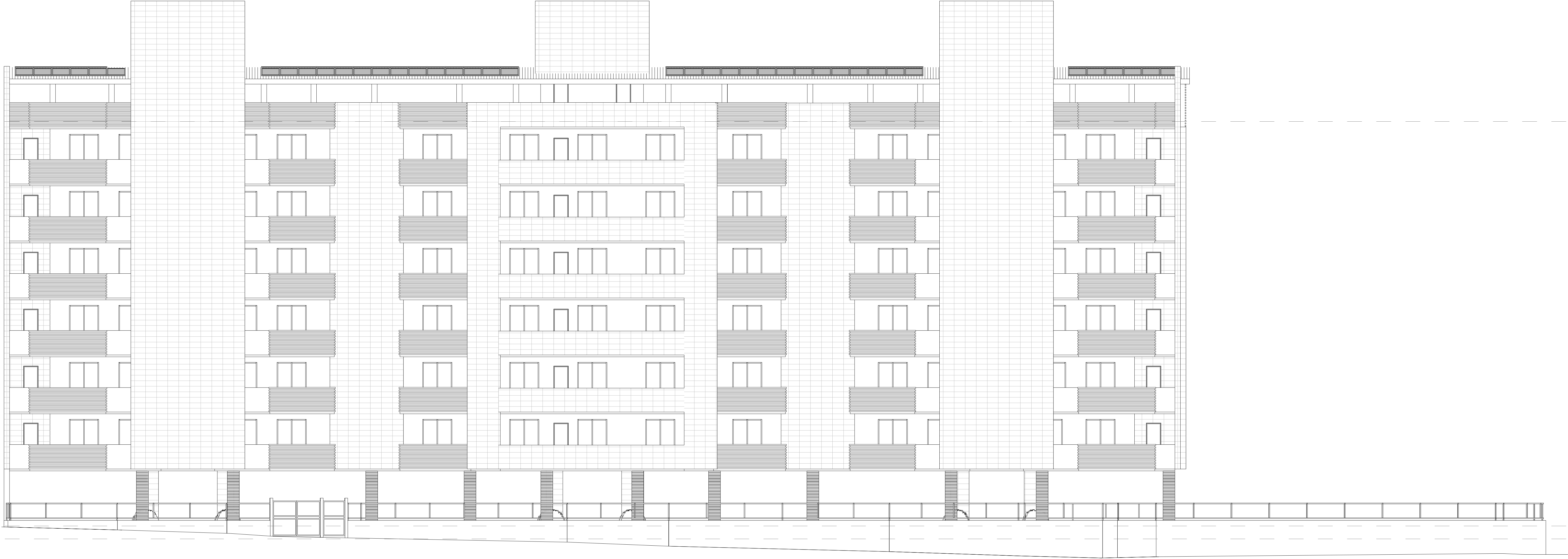
PROSPETTO LATERALE DESTRO