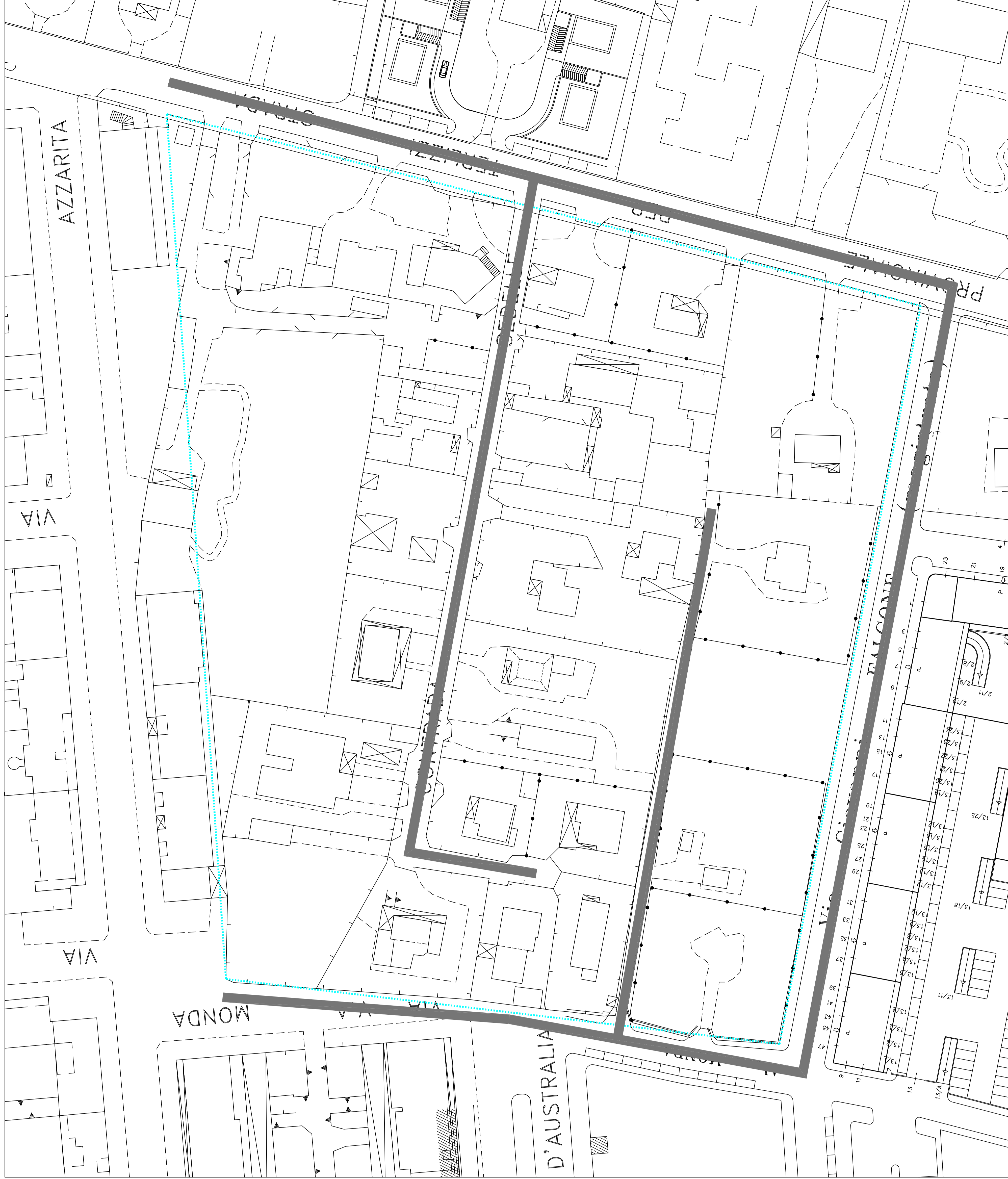
INDIVIDUAZIONE DELLA VIABILITA' INTERNA scala 1:500